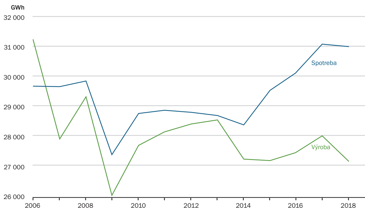
Graf 2: Vývoj výroby a spotreby elektriny v SR